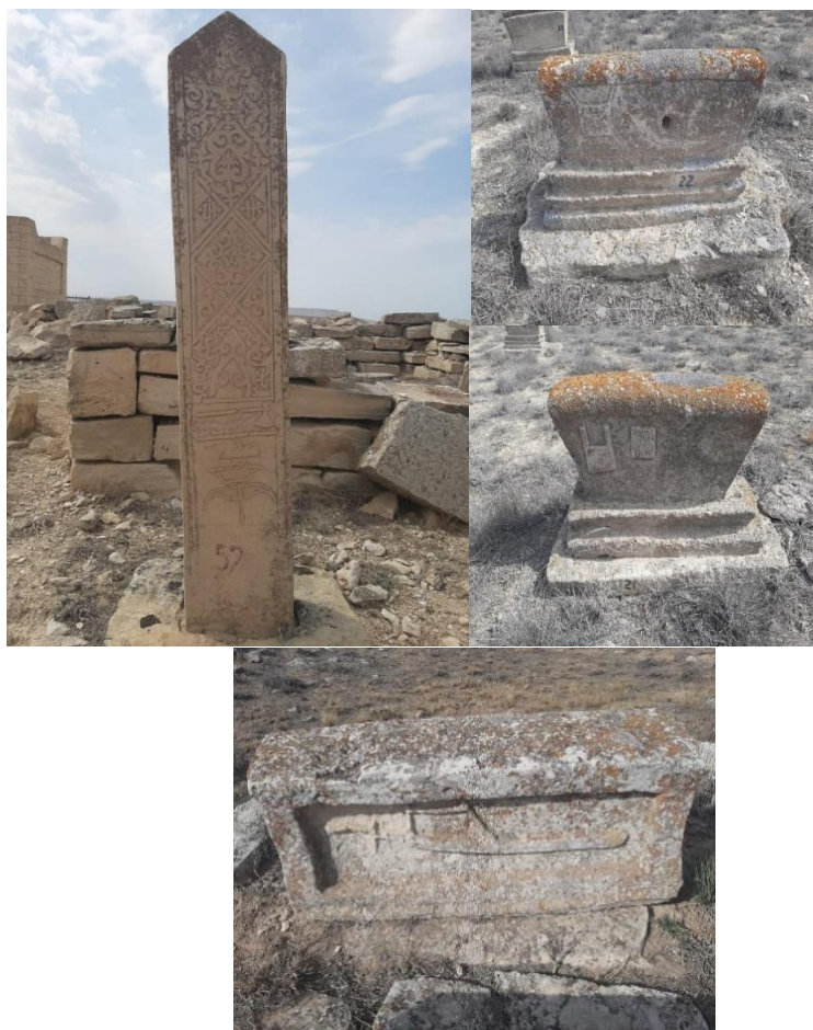
Сурет 1 - Шақпақ Ата, Үштам, Шопан Ата кешендеріндегі құлпытас түрлері.