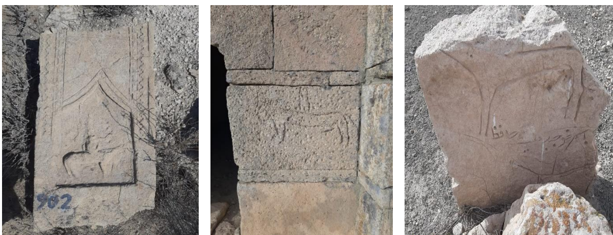
Сурет 2 - Шопан Ата қорымы. Салт аттының барельефі бар құлпытас. Үштам кесенесінің кіре берісіндегі ат бейнесі

далалықтардың идеологиясына сәйкес және нақтылы құрбандық рәсіміне арналған ат байлайтын баған туралы идеясы. Осындай ойылған бағандар Еуразияның көптеген жылқы өсіруші халықтарының этнографиясында белгілі және біздің құлпытастарға өте жақын формада. Олар якуттардың, буряттардың, алтайлықтардың «сэргэ» және «чақы»; мадиярлардың «фейфа – құлпыағаш»; ханттардың «құрбандық жылқының бағаны» және т.б. Бұл ағаш ат байлағыштар тұрғын үйде, рәсімдер өткізу кезінде бейіт басына қойылған. Бейітбасылық ат байлағыштар (мамағаш) қазақтарда да белгілі болған. Бұл тұрғыда Батыс Қазақстан құлпытастары ағаш ою дәстүрінде орындалғаны, демек олардың арғы тегі ағаш бағандар болғанының көрнекті дәлелі. Тағы да бірнеше стелаларда құрбандыққа апарар жылқының көне образы сақталған. Мұндай жәдігер ескерткіштер Маңғыстау мен Үстіртте жүзден кем емес екені белгілі, солардың бірі, жылқы бейнеленген керемет барельефі бар Шопан Ата қорымындағы бір құлпытастың бетінен көре аламыз. (2-сурет).