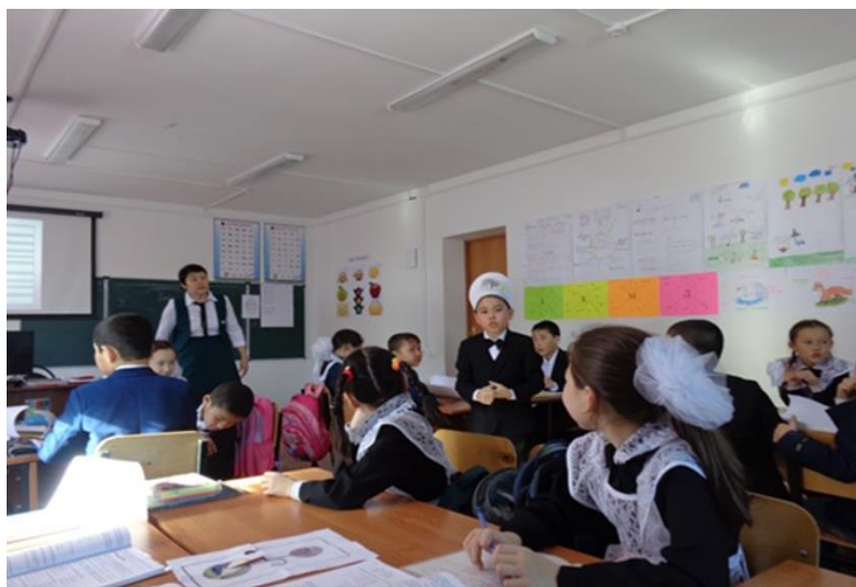
Сурет 2 - «Алтын балыққа арналған аквариумы» әдісі

«Алтын балық» рөліндегі оқушы тақырып бойынша және өткен сабақпен байланыстырылған сұрақтар бойынша да дайын болуы керек еді. Алтын балықты ортаға шақырғанда дарынды оқушылар бірінші болып белсенділік көрсетті. Оқушылардың өздерінің алтын балыққа сұрақтар қою барысында жабық сұрақтан ашық сұраққа көше бастағанын байқадым. Яғни мұғалімнің сұрақтары оқушылардың ойлау қабілетін ашады, айқындайды және кеңейтеді деген тұжырымға сәйкес болуы керек деген қорытындыға келдім. Сұрақтарды қоя білу стратегиясыз айтарлықтай ілгерілеу, сабаққа беріліп жұмыс істеу және сапалы бағалау болуы мүмкін емес деген тұжырым менің де көзқарасымды айқындай түседі.