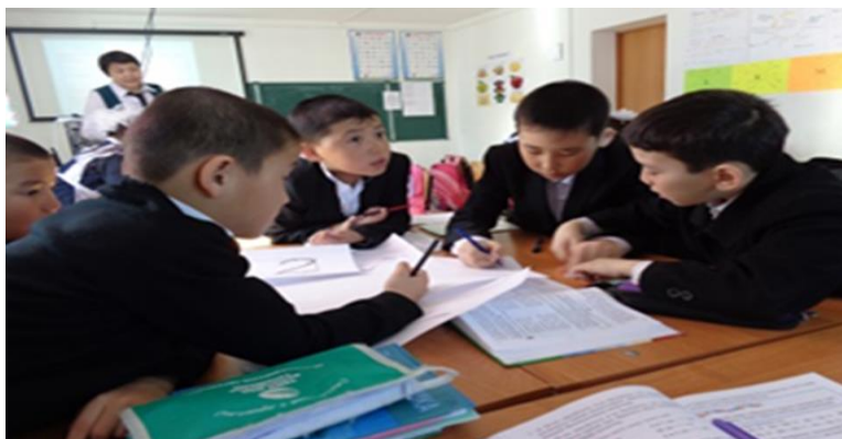
Сүрет 3 - Диалогтық оқыту арқылы демократиялық сыныптарды дамыту

Фриери, мұғалімнің міндеті - оқушының білімін толтыру, көбейту тенденциясымен емес, білімді тауып, дамыту арқылы тереңдетуге бағытталған көзқараспен оқушылармен диалогқа түсу деп санайды (2007 ред., 43-б). Осы мақұлдау жаңашыл болып табылады. Ең алдымен, Л.С.Выготский оқытуда диалогқа басты рөлді беруді ұсынған; ол енгізген «жақын маңдағы даму аймағы» мен Сократтың ұсынған «эленхос» сияқты (Abbs бойынша цитата 2003, 15-бет) түсінігі, диалогтік әңгімеге қатысушылардың біліміндегі кемістіктерді көрсететінін дәлелдейтін теорияның мағынасын анықтайды. Фриери осы теорияны ары қарай дамытуда, оқушы мен мұғалімнің арасындағы диалог процесінің рөлі мен қатынасын қарастыруда, осындай диалогтың мақсаттарын анықтауда көп еңбек сіңірген. Ендеше, сабақ барысында оқушы мен мұғалімнің арасындағы диалогты ескере отырып, сұрақ-жауап тапсырмалары да ескерілді[7].