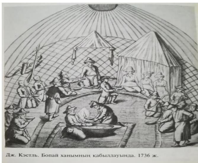
Дж. Кэстль. Бопай ханымның қабылдауында. 1736 ж.

Бопай Әбілқайыр ханның жанында үнемі болған. Саясаттағы көрегендігін байқаған Әбілқайыр хандықтың маңызды мәселелеріне оны түгел араластырып отырған. Қызылқұмдағы әйел заты қатыспайтын құрылтайға да ханымды алып барған. Өте зерек, саясаткер Бопай ханым саяси мәселелерді шешуде белсенділік танытқан. Әбілқайыр хан сарайында қолданылған тәртіп ереже бойынша шет ел елшілерін қабылдау кезінде ханның әйелдері де қатысқан. Бұл туралы сол кездегі деректерден көреміз. Сондай-ақ бұны ағылшын суретшісі, орыс патша үкіметінің қазақ даласын отарлау мақсатында XVIII ғасырдың 30-жылдарында ұйымдастырылған Орынбор экспедициясына қатысушы Джон Кэстль күнделігіндегі жазбалардан және «Бопай ханымның қабылдауында» атты (1736 жылы) суретінен айқын көреміз.