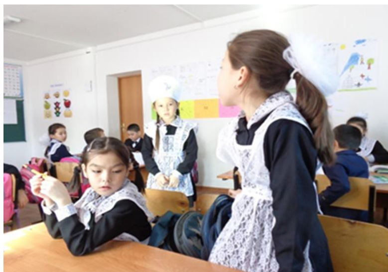
Сурет 1 - «Мен саған, сен маған» әдісі

Біз сыныпта не үшін сұрақ қоямыз? Сұрақ арқылы жаңа ақпаратты алуға, сұрақ қою арқылы білгенін нақтылай түсуге болады. Дұрыс қойылған сұрақ жауабын табуға бастама. Тиімді сұрақтар қандай болады? Жақсы сұрақ деген не? Ашық сұрақ сөйлеу, ойлауын жетілдіреді. Сіздің сыныбыңызда тиімсіз сұрақтың көбін кім қояды? Неліктен? Бір-біріне сұрақ қою, оларға жауап беру үдерісіне барлық оқушыларды қалай тартасыз? Сұрақ қоюға және оларға жауап беруге ынталандыру үшін сіз сыныпта қандай жаңа тәсілдерді пайдаланасыз? «Мен саған, сен маған», «Неге? Неге?», «Ыстық орындық», «Ұшақ ұшыру», «Серпілген сауал», «Ауадағы сұрақ», «Ыстық орындық» «Сұрақты теріс айналдыр» «Иә, жоқ» жабық сұрақ, әдістері арқылы ойлануға 5 секунд уақыт беруге болады. Сұрақты алдын-ала жоспарлап, сұрақ қою әдісін үнемі өзгертіп отыру, барлық оқушылардың жауап беруіне мүмкіндік берілгені жөн.